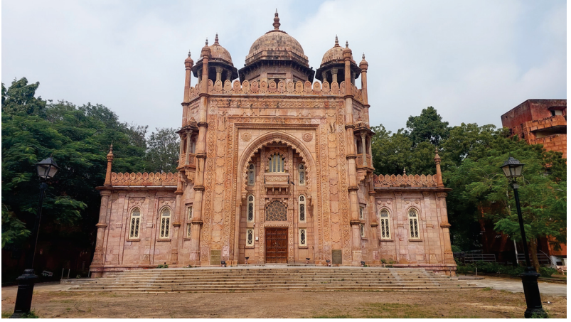
அச்சிட்டோர் : அரசு மைய அச்சகம், சென்னை-600 001.