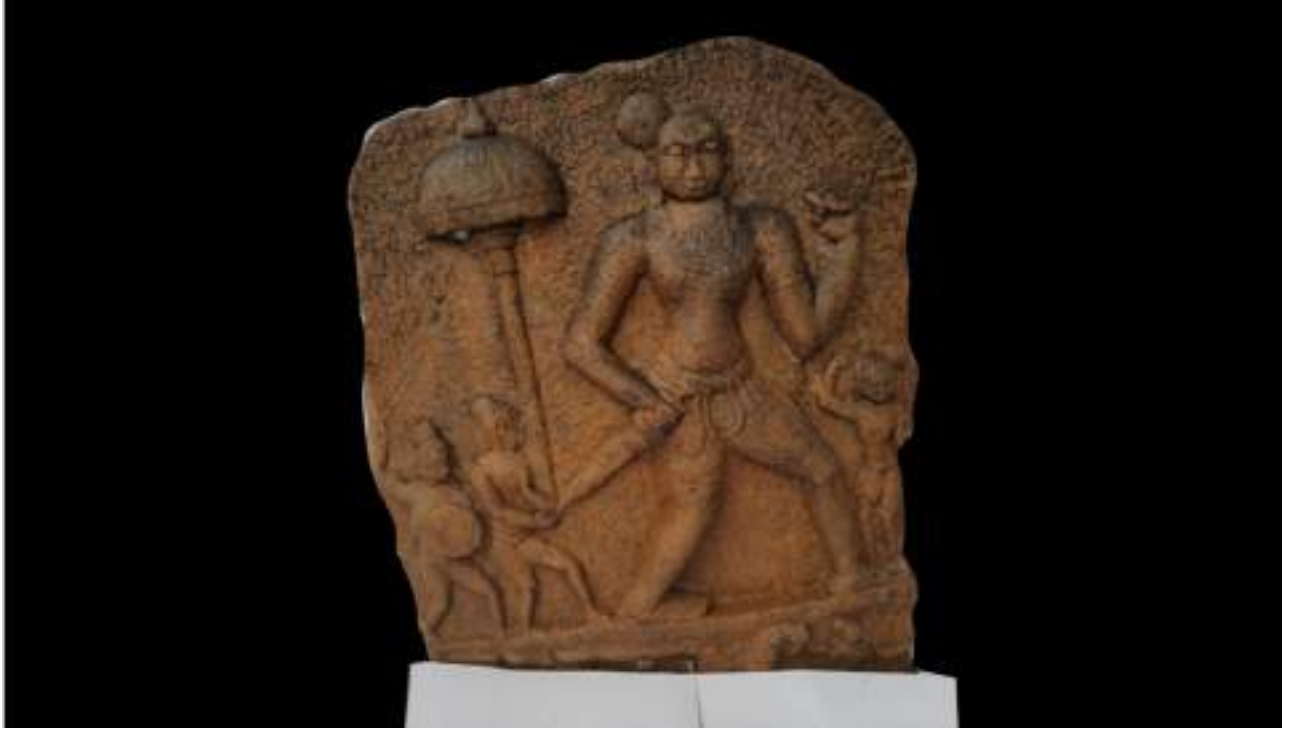
வீரக்கல், 13-ஆம் நூற்றாண்டு, திருச்செங்கோடு, நாமக்கல் மாவட்டம், அரசு அருங்காட்சியகம், சேலம்