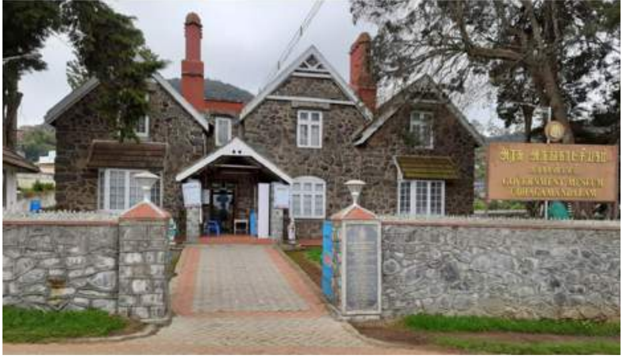
கல் இல்லத்திற்கு மாற்றப்பட்ட உதகமண்டலம் அரசு அருங்காட்சியகம்