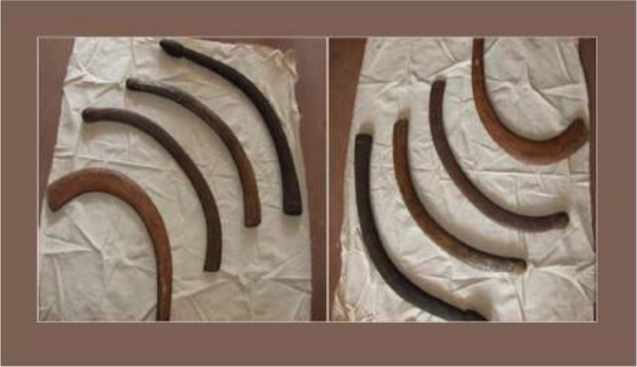
பல்வேறு வகையான வளரிகள், அரசு அருங்காட்சியகம், சிவகங்கை