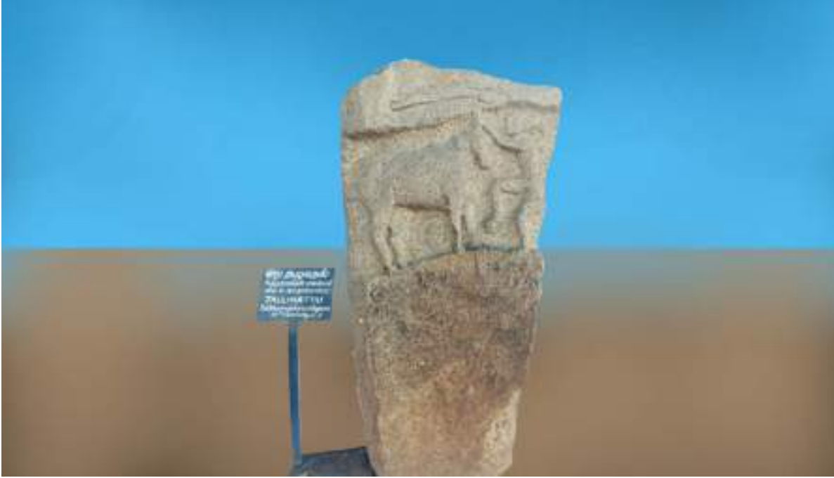
ஐல்லிக்கட்டு வீரக்கல், பெத்தநாயக்கன் பாளையம், சேலம், கி.பி. 16-ஆம் நூற்றாண்டு, அரசு அருங்காட்சியகம், சேலம்