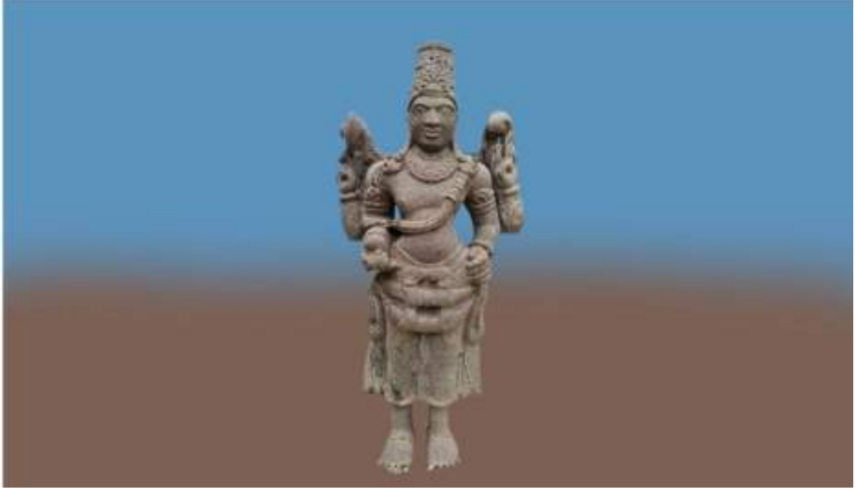
புனிதவாசர் கற்சிலை, 9-ஆம் நூற்றாண்டு, அரசு அருங்காட்சியகம் கன்னியாகுமரி