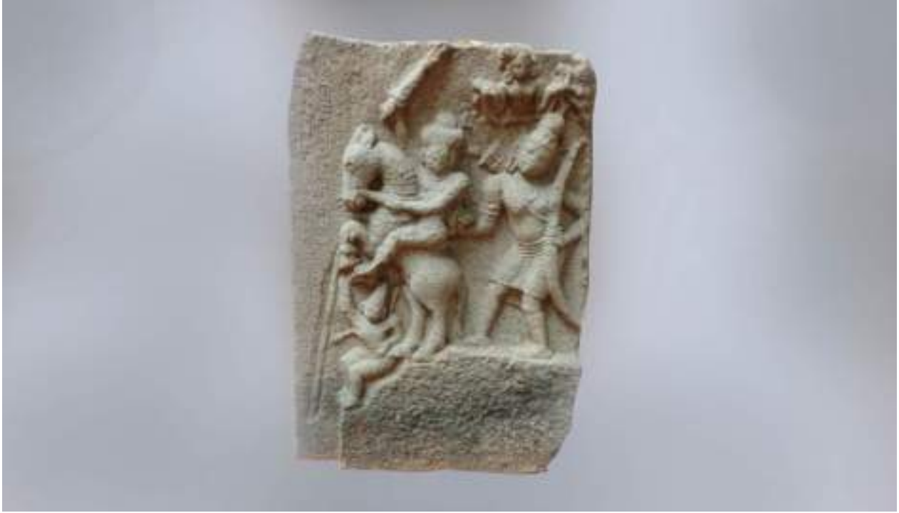
நடுகல், 16-ஆம் நூற்றாண்டு, இளவேளங்கால், அரசு அருங்காட்சியகம், திருநெல்வேலி.