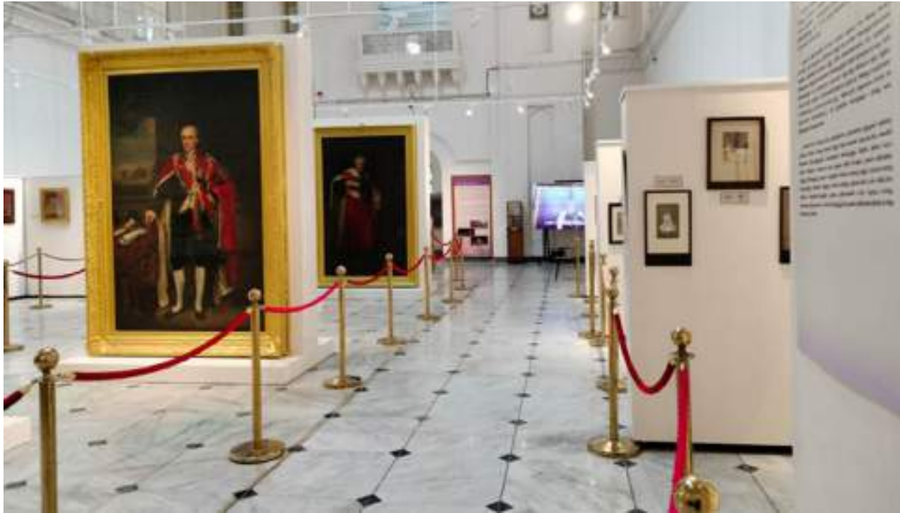
புதுப்பிக்கப்பட்ட தேசிய கலைக் கூடத்தின் உட்புறத்தோற்றம்.