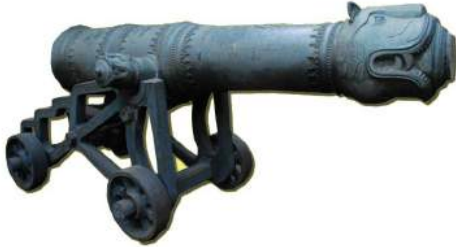
திப்பு சுல்தான் பயன்படுத்திய பீரங்கி அரசு அருங்காட்சியகம், எழும்பூர், சென்னை.