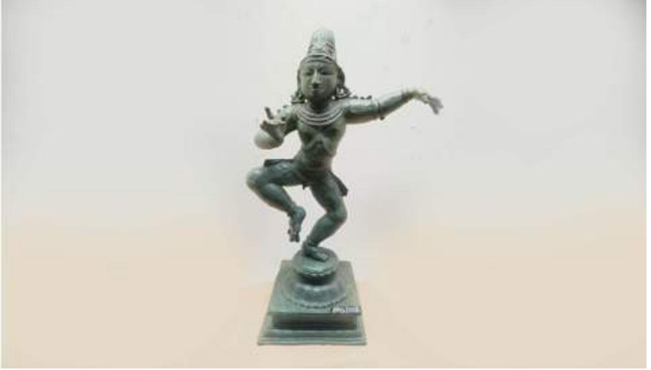
திருஞானசம்பந்தர் உலோக சிலை, 14-ஆம் நூற்றாண்டு, குடவாசல், திருவாரூர் மாவட்டம்