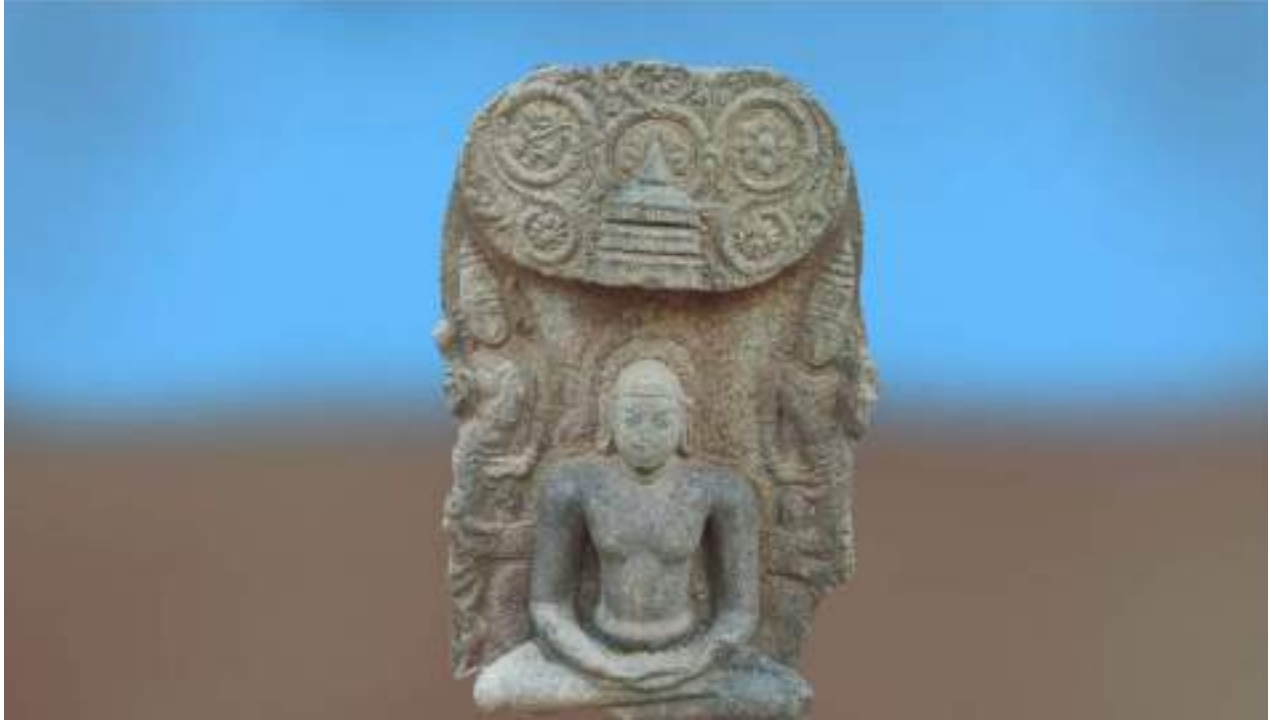
மகாவீரர், 10-ஆம் நூற்றாண்டு, முள்ளிகருப்பூர், திருச்சிராப்பள்ளி